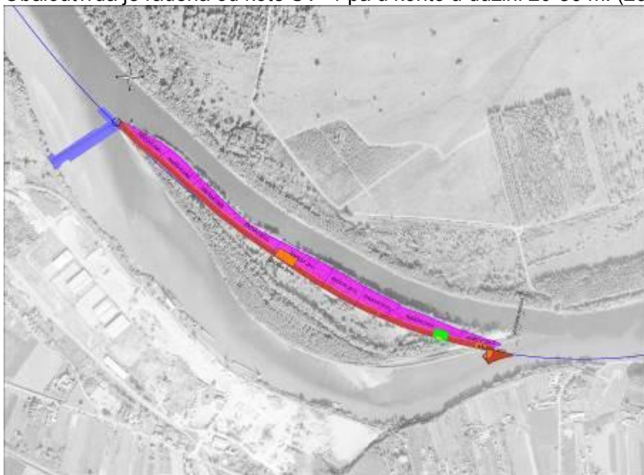
Slika. 1: Pregledna situacija – pregled dosadašnjih aktivnosti

Na uređeni pokos obale izvedena je obaloutvrda u vidu stabilizacijskog madraca od geotekstila kazetiranog fašinskim kobama obloženog kamenom krupnoće od 15 do 30 cm. Obaloutvrda je rađena od kote SV+1 pa u korito u dužini 20-30 m. (2007. – 2015. godina).